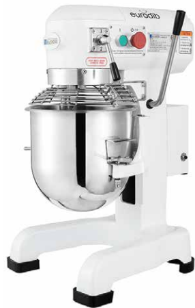
M10 ETL - 10 Qt