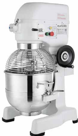
M40A 220ETL - 40 Qt

★ Les Mélangeurs M10 ETL , M20 ETL et M30 ETL NE CONVIENNENT PAS à la pâte à pizza, pita ou pain. Arrêtez la machine au changement de vitesse.