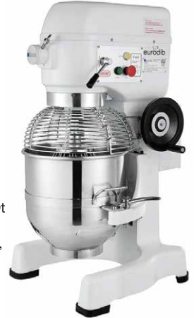
M30 ETL - 30 Qt